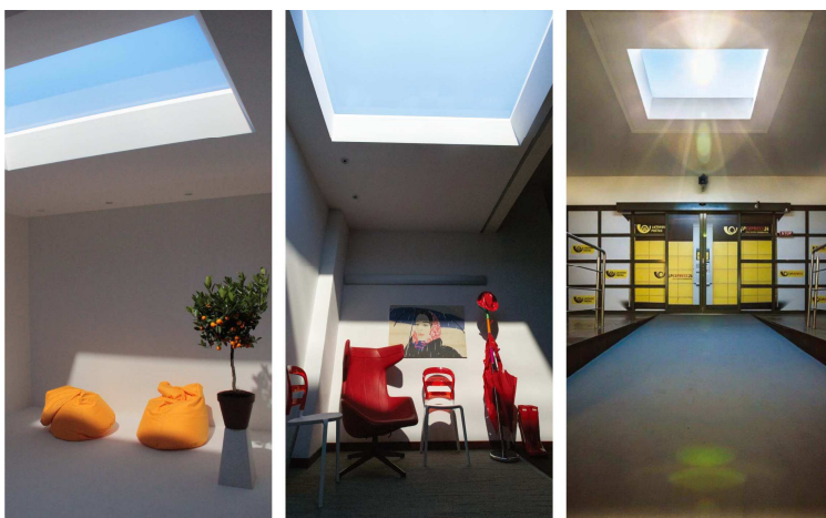
コールクス照明システム

現状では、窓のないオフィスや病院、福祉施設などで青空に見える照明が検討されていますが、今後、価格が落ち着けば、店舗や一般家庭にも広がってくる可能性が大いにあるでしょう。